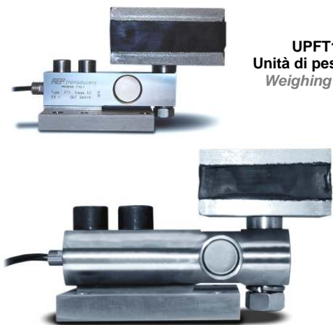
UPFT1 Unità di pesatura. Weighing unit.